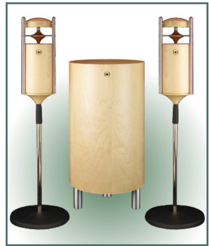
System Ahorn auf Chromständern