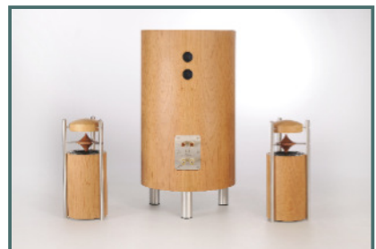
System Kirschbaum ohne Ständer